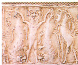
Gilgamesh , el legendario rey sumerio, luchando con dos leones. Esta impresión está tomada de un sello cilíndrico hallado en la antigua ciudad de Ur, y data de entre el 2500 y el 2400 a.C.